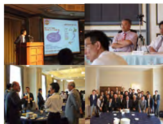
※写真は昨年のF C社長会

炭の家グループはこれからの更なる発展を目指し、営業手法や施工技術の情報交流を目的に全国から一同に集まる“第1回「炭の家」グループ全国大会”を開催します。「炭の家」の供給棟数も前年対比250%となり、導入法人も25社(8月末現在)になりました。今大会をつうじて交流が深まりグループ全体の活性化につながることに期待しています。つぎの炭タイム21号誌面で開催の様子をレポートしたいと思います。