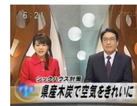
ニュース番組で報じられ話題に!

もうすぐ1年が経ちますが、地産地消の取り組みが地元のTVに取り上げられ、その反響から多数のお問い合わせを頂けたことで集客、受注とも非常に手ごたえを感じているところです。